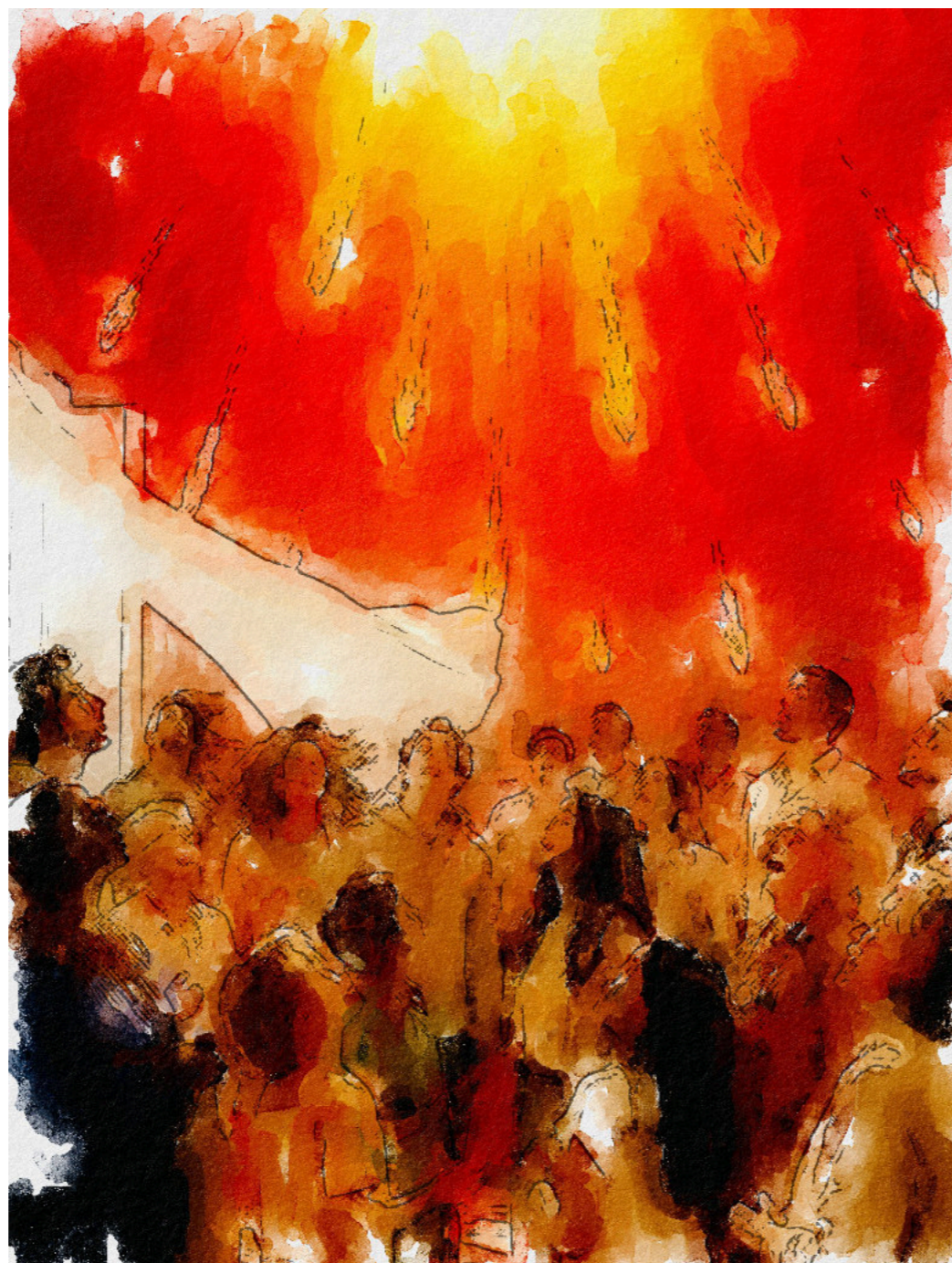
Gräfi Albert Lachnit (Photoshop, KI)

Und jetzt wird es unbequem: Wie gehe ich eigentlich mit dieser Beziehung um? Pflege ich sie? Nehme ich sie überhaupt wahr? Oder