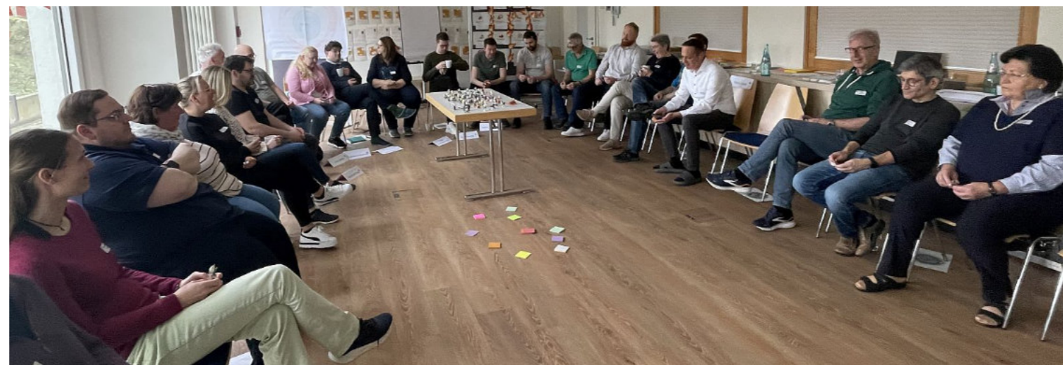
Bei der Klausurtagung des Pfarreirates wurden viele Beschlüsse gemeinsam auf den Weg gebracht.

Die Arbeit soll stärker strukturiert und thematisch gebündelt werden. Dazu fasste der Pfarreirat am Samstagnachmittag mehrere wegweisende Beschlüsse zur künftigen Arbeitsorganisation. Die bestehenden Themengruppen der Kirchenentwicklung 2030 sollen im Jahr 2026 zunächst in gewohnter Form weiterarbeiten, während parallel neue Strukturen aufgebaut werden.