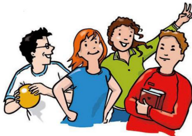
Grafik: Dorothee Wolters © BDJK DV Freiburg und Abt. Jugendpasoral Erzbischöfl. Seelsorgeamt